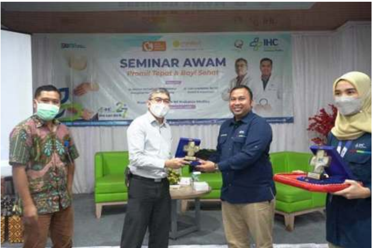
Seminar Awam Promil Tepat dan Bayi Sehat