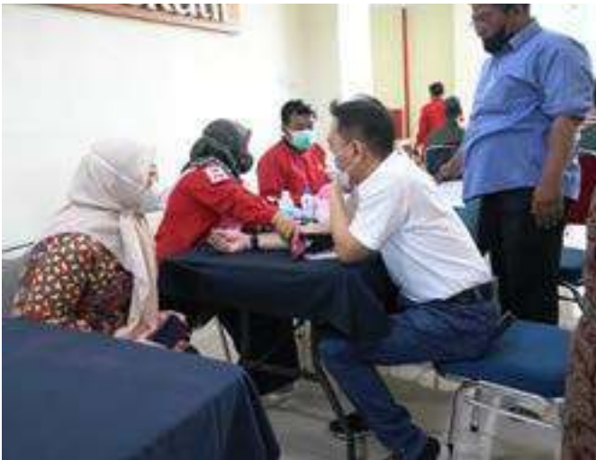
Kegiatan Donor Darah